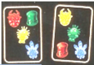
carte Voodoo cartea lui Lea de pe masa

Indicați o carte care conține combinația de ingredient și culoare care lipsește de pe masă, puteți pune jos o carte careia îi lipsește aceeași combinație. Dacă puneți această carte pe masă, strigați "Voodoo". Jocul se oprește imediat iar jucătorii pun cartile jos. Toți jucătorii, cu excepția celui care a strigat "Voodoo", trebuie să ia o carte de sub teancul de cărți Voodoo de pe masă. Jucătorul aflat în stanga celui care a strigat "Voodoo" este cel care extrage primul.